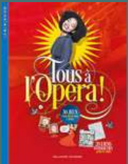
Tous à l'Opéra ! Béatrice FONTANEL, Illustré par Cynthia THIÉRY Gallimard jeunesse (9 à 12 ans)