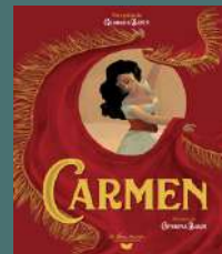
Carmen Georges BIZET, Illustré par Caterina BALDI Gallimard jeunesse (7 à 9 ans)