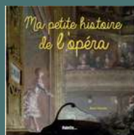
Ma petite histoire de l'Opéra René Palacios Palette (dès 9 ans)