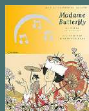
Madame Butterfly de Puccini (Auteur), Renata Fucikova (Illustrations) Calligram, Musigram (dès 3 ans)