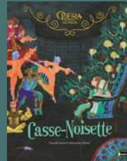
Casse-Noisette Opéra National de Paris - (Dès 5 ans) de Pascale Maret, Alexandra Huard